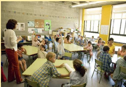
CEIP Vila Olímpica 2

La diversitat ben enfocada és una riquesa per a tots els alumnes