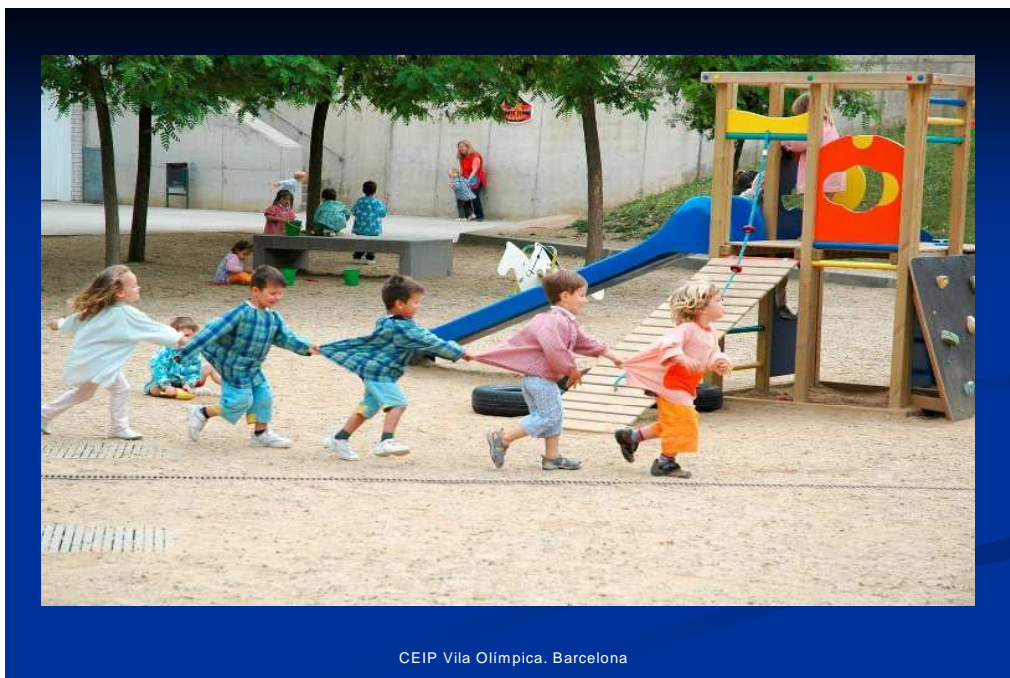
CEIP Vila Olímpica. Barcelona